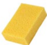
натуральная морская или синтетическая губка