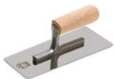
шпатель металлический (кельма)