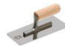
шпатель металлический (кельма)